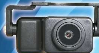
リアカメラ / フロントカメラ